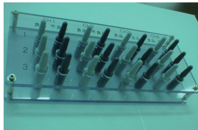
テストアンブルセット